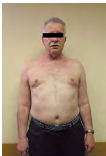
Рис. 6. Умеренно выраженные атрофии мышц плечевого пояса и грудных мышц

также от онкологического заболевания. Брат пациента, 69 лет, считает себя здоровым и никаких сведений о себе не предоставил.