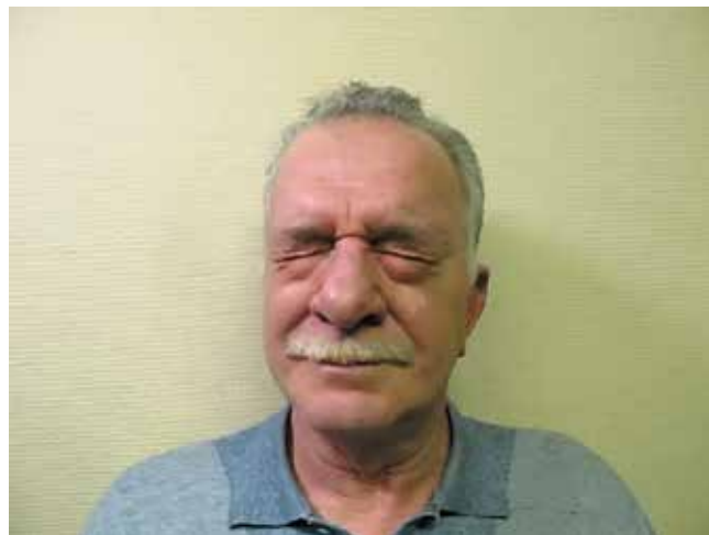
Рис. 3. Слабость круговых мышц глаза