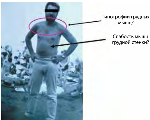
Рис. 1. Пациент А. в возрасте 39 лет. Комментарий: «Полон жизненных сил, немного больше, чем раньше, устаю играя на отдыхе в волейбол... В целом считаю себя совершенно здоровым человеком». Печатается с разрешения пациента.

чем у сверстников: «ноги были слабее, чем руки, также стал хуже прыгать и кататься на коньках». Из особенностей: с детства всегда плохо свистел; никогда не мог сидеть на корточках, данные медосмотров в школе и во время службы в армии говорят, что показатели жизненной емкости легких (ЖЕЛ) были всегда на нижней границе нормы. В 27 лет проходил военную службу в армии, где отметил, что ему трудно играть в футбол из-за слабости в ногах и что он не может подтягиваться на турнике, но может отжаться от пола; в 29–30 лет появилась привычка опираться на руки при подъеме со стула. В последующем занимался любительским