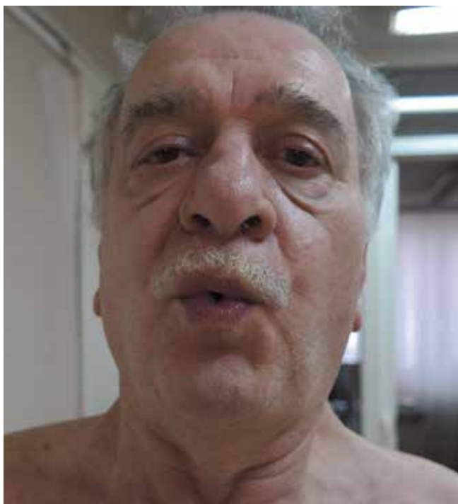
Рис. 2. Свист

чем у сверстников: «ноги были слабее, чем руки, также стал хуже прыгать и кататься на коньках». Из особенностей: с детства всегда плохо свистел; никогда не мог сидеть на корточках, данные медосмотров в школе и во время службы в армии говорят, что показатели жизненной емкости легких (ЖЕЛ) были всегда на нижней границе нормы. В 27 лет проходил военную службу в армии, где отметил, что ему трудно играть в футбол из-за слабости в ногах и что он не может подтягиваться на турнике, но может отжаться от пола; в 29–30 лет появилась привычка опираться на руки при подъеме со стула. В последующем занимался любительским